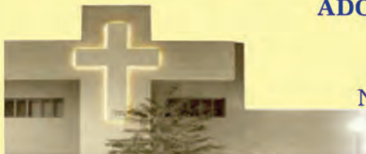
Jezuicki Ośrodek Milenijny

w niedzielę - pół godziny przed każdą mszą świętą, Spowiedź w 1. piątek miesiąca - 7:30-8:30; 17:30-19:30